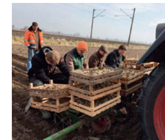
Kartoffel-Projekt: Q1 – 2018/19 in Lehrte