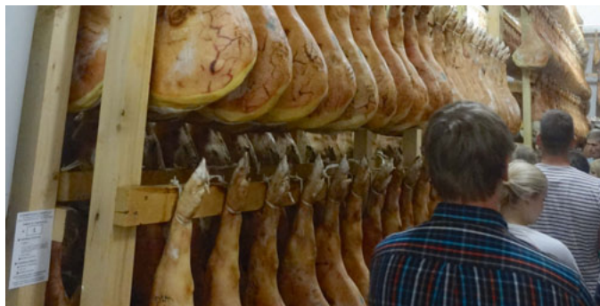
Studienfahrt nach Italien, Schinkenherstellung in San Daniele